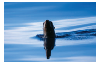
Lobo marino californiano