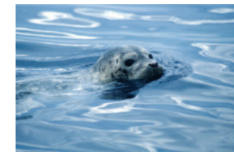
Foca común (foca del puerto)

El océano es eco sistema excepcional, lleno de vida y recursos, pero también es un mundo frágil. Polución, cambios climáticos y sobrepesca son sólo algunos de los problemas que afectan nuestras aguas, pero la verdadera cuestión es el impacto humano acumulado en nuestros océanos. Hoy numerosas especies de mamíferos marinos están amenazadas, en peligro o críticamente en peligro, y algunas ya han desaparecido en las últimas décadas. Otra amenaza significativa a las ballenas son los golpes de las naves. En años recientes, las Ballenas Azules que están en peligro de extinción, y que miden hasta 30 metros (90 pies) de largo, se volvieron visitantes frecuentes de la Ensenada del Sur de California, usando esta área para la búsqueda de alimento. Estas ballenas, desafortunadamente, tienden a moverse a lo largo de las mismas rutas usadas por los barcos de línea de transporte comercial. Los golpes fatales de los barcos son un problema recurrente. Acoso por los humanos, aún cuando sus intenciones sean buenas, pueden afectar adversamente la conducta normal de las ballenas, delfines y otros mamíferos marinos. Seamos cuidadosos para minimizar nuestro impacto y respetemos a los mamíferos marinos mientras disfrutamos su presencia y aprendemos de ellos.